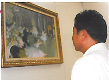
▲葉先生在植入矯正散光的人工水晶體後，更能感受到生活中的細緻美感

五十三歲的葉先生一向活潑好動，喜愛戶外大自然，平時開車到山裡遊走是最快樂的事。前些日子發現